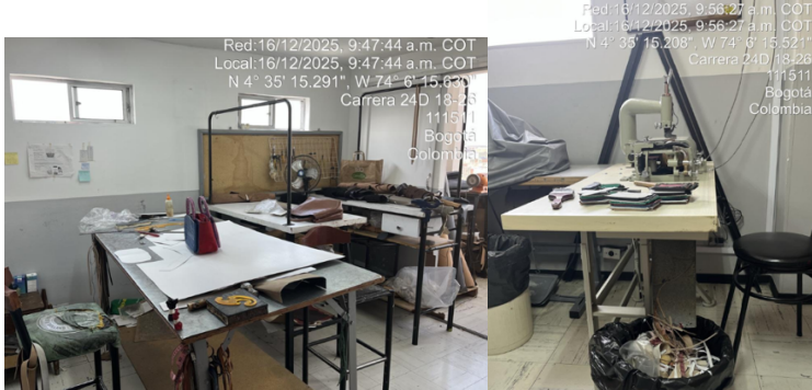
Fotografía 3. Área de moldaje Fotografía 4. Área De corte