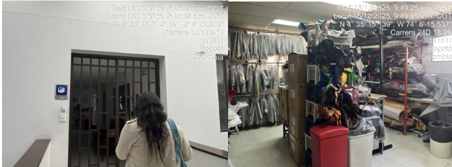
Fotografía 1. Sede principal en la Cra. 24 D No 18-24 Sur oficina 502de la localidad de Antonio Nariño. Fotografía 2. Área de almacenamiento de pieles de diferentes especímenes y otros materiales