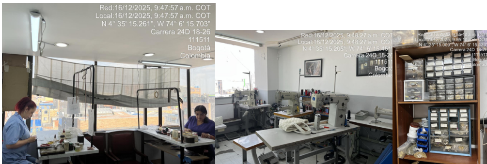
Fotografía cinco. Área de costura y armado Fotografía 6. Área de costura y armado