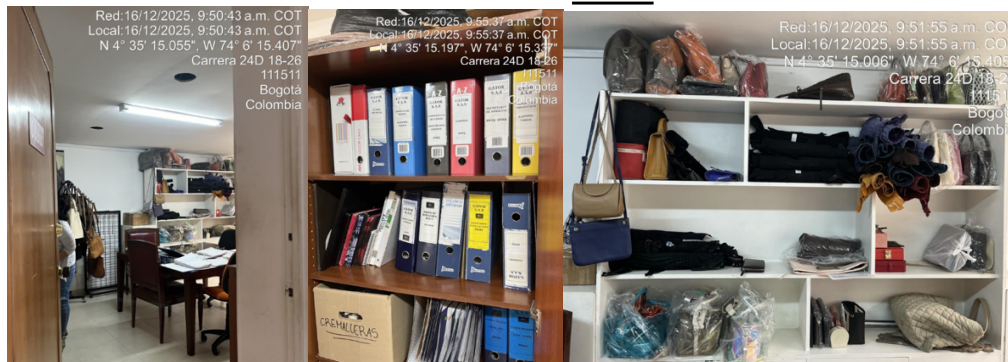
Fotografía 7. Área administrativa y archivo Fotografía 8. Área de exhibición